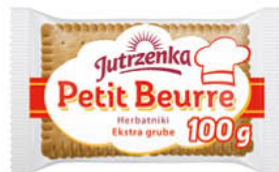
Herbatniki: Petit Beurre Jutrzenka 100g