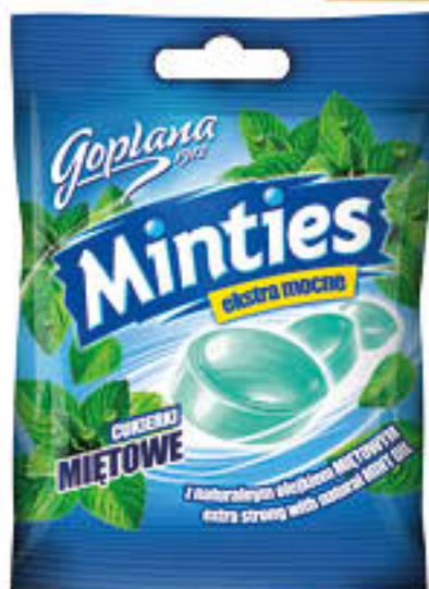
Cukierki: Goplana wybrane rodzaje 90g