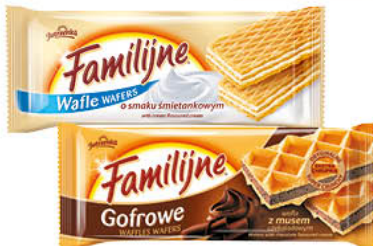
Wafle: Familijne/Gofrowe wybrane rodzaje 130-180g