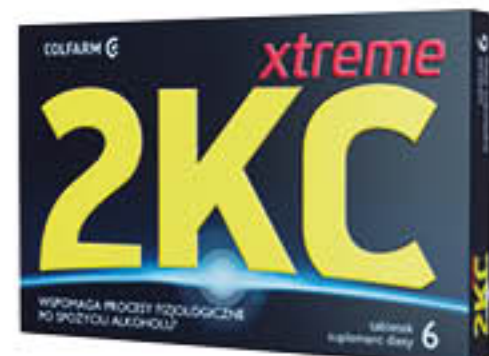
2KC Xtreme 6 tabletek