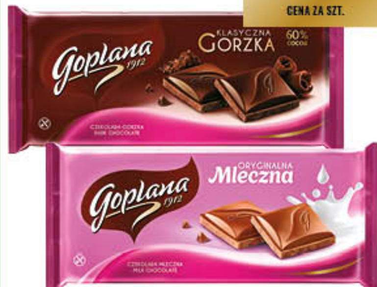
Czekolada: Goplana klasyczna gorka, oryginalna mleczna 90g