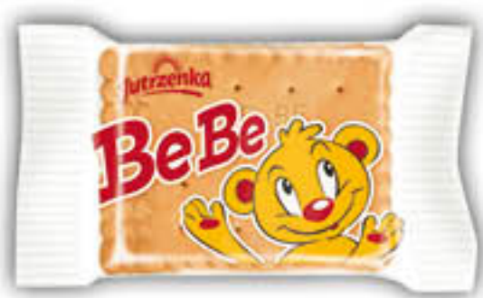
Herbatniki: Be-Be Jutrzenka 16g