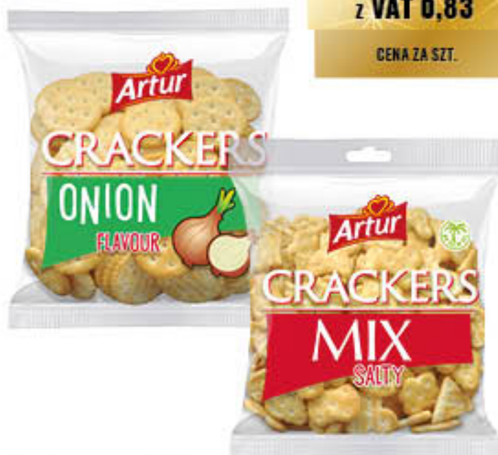
Krakersy: Artur mix, cebulowe 90g