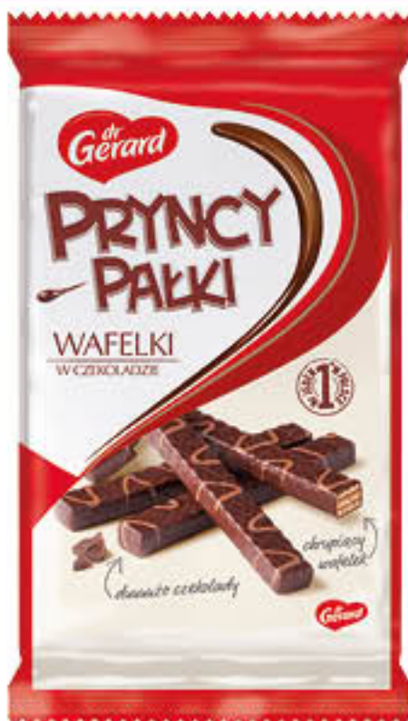
Wafle: Pryncypalki Dr Gerard wybrane rodzaje 200g