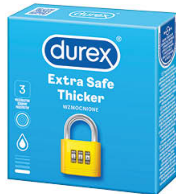
Prezerwatywy: Durex extra safe x3