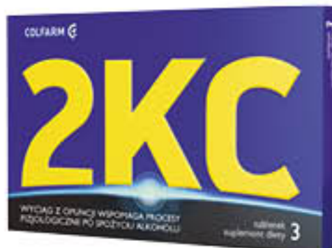
2KC 3 tabletki