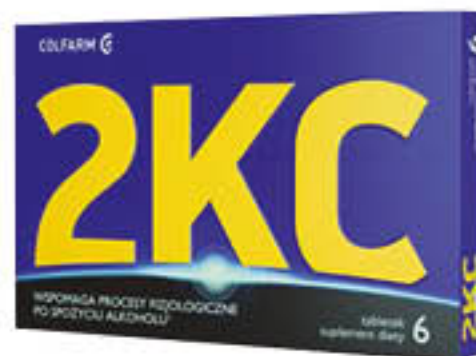
2KC 6 tabletek